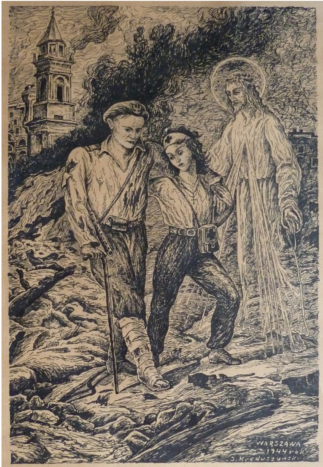
1. S. Kreduszyński, Warszawa 1944 rok – Chrystus Miłosierny i powstańcy. Rys. piórkiem na kartonie. Fot. autor